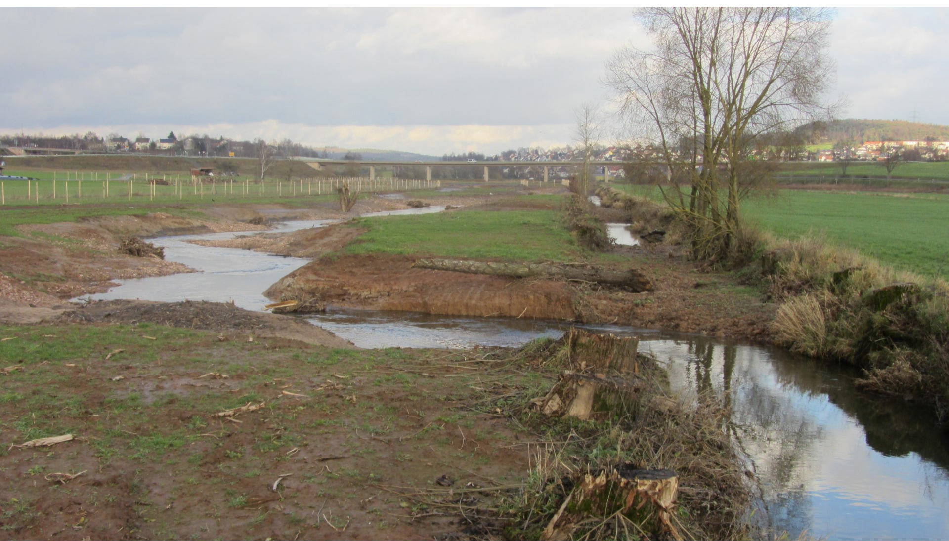
Die Fliede renaturiert