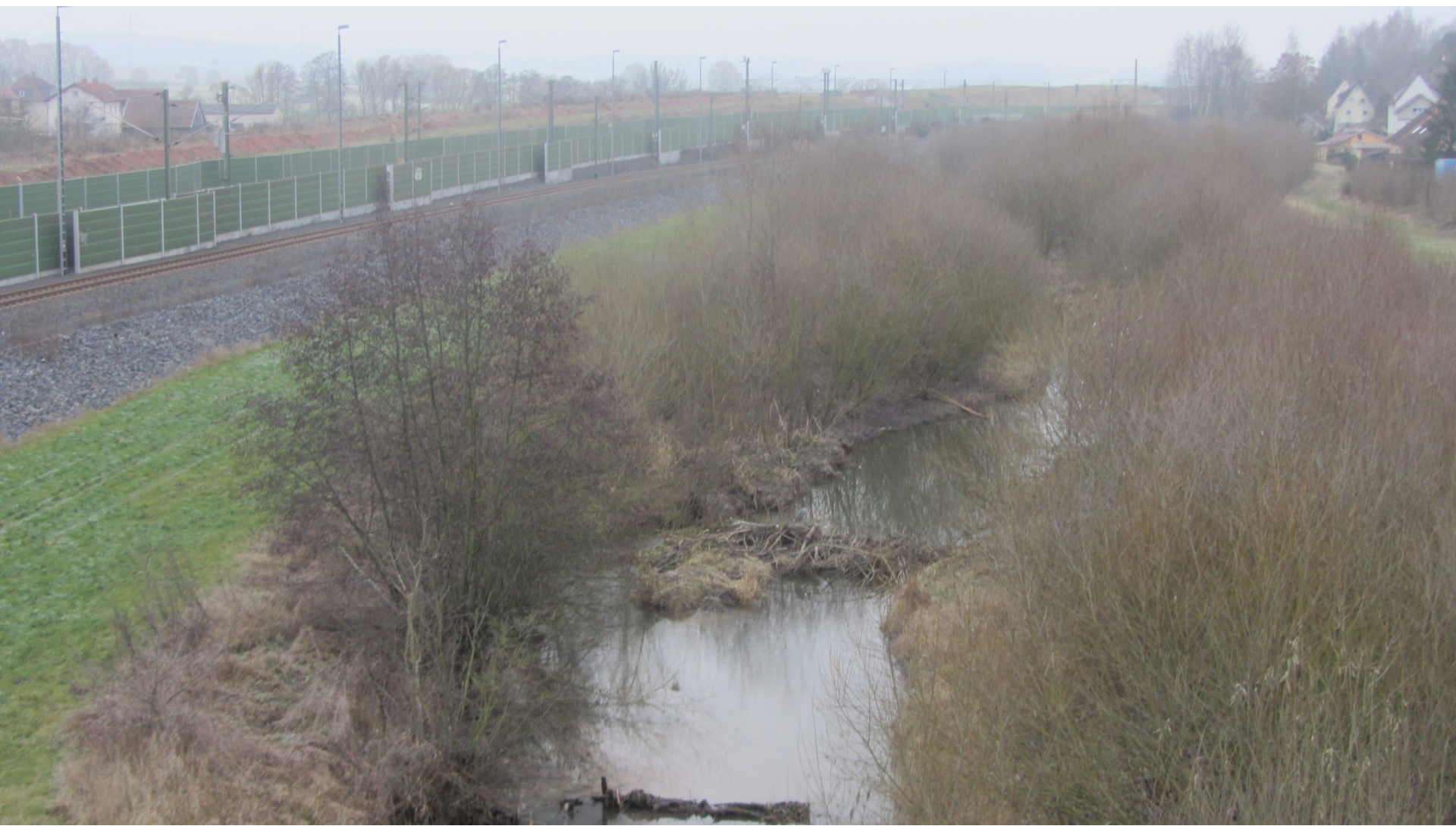
Biber Ortschaft Neuhaus Richtung Fließen