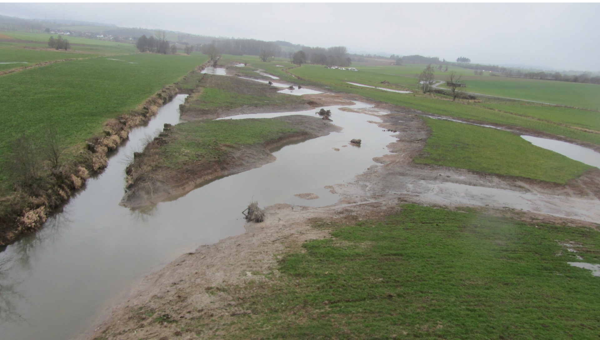
A66 Renaturierung auf 600m