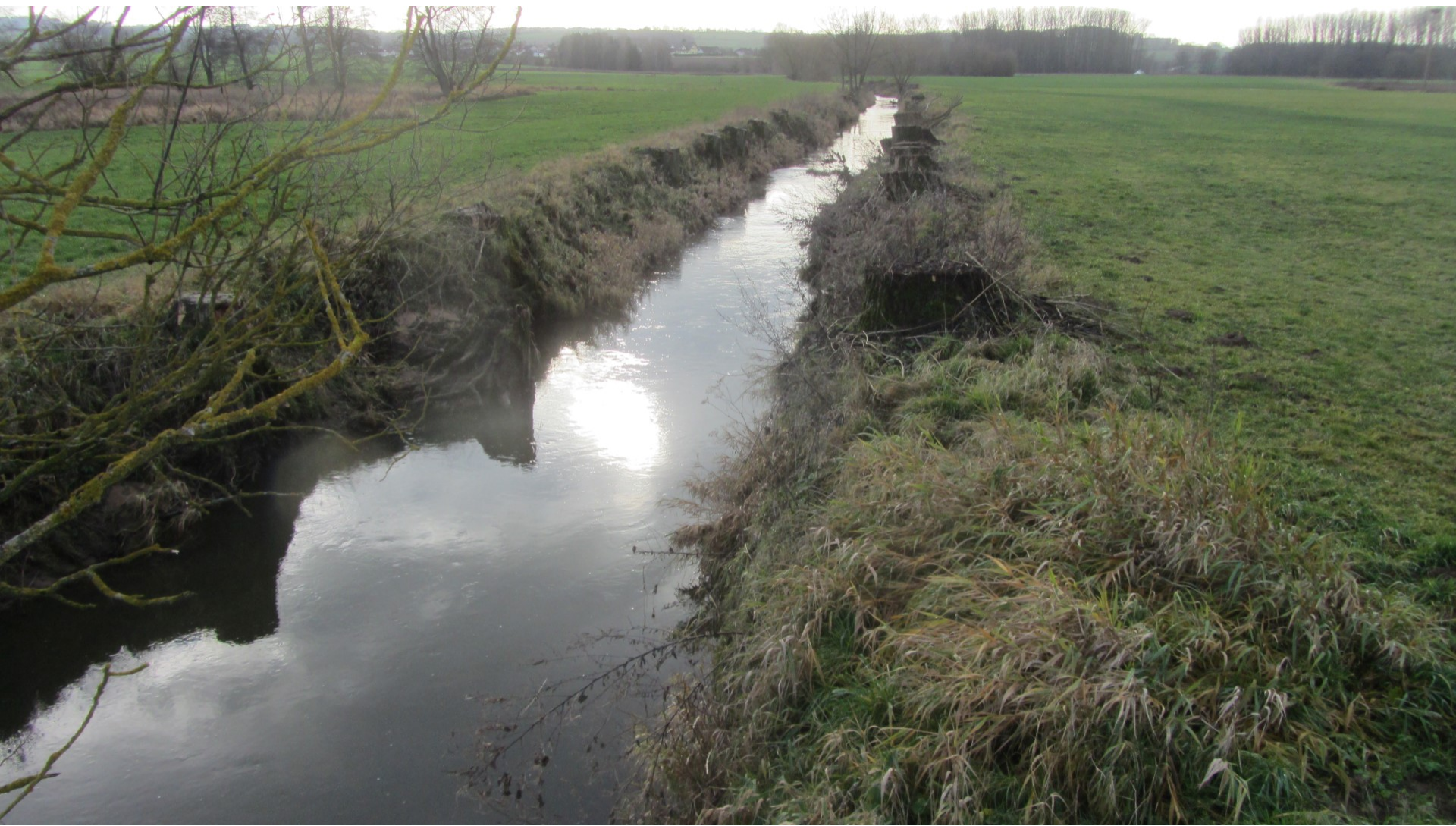
Die Fliede denaturiert